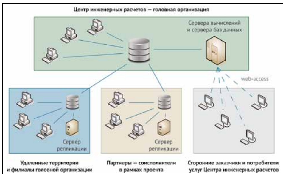
Рис. 1. Концептуальная архитектура центра инженерных расчетов